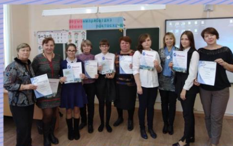
Секция «Город и люди»