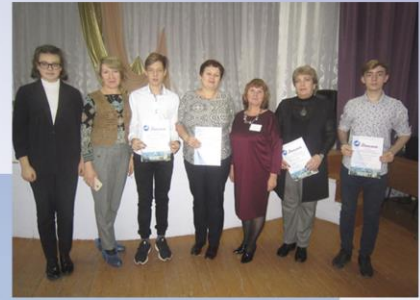
Секция «Военная история»