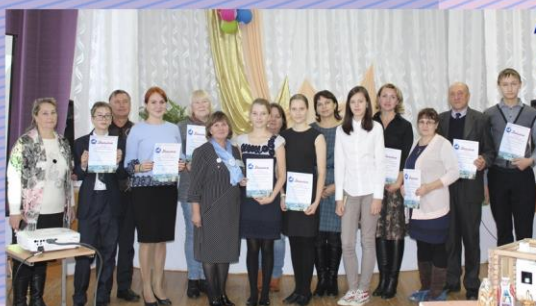
Секция «Историческое краеведение»