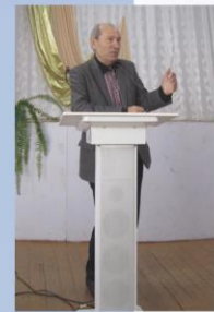
Почетный гость Моисеев Г.С., председатель Общественной палаты г. Каменск-Уральский