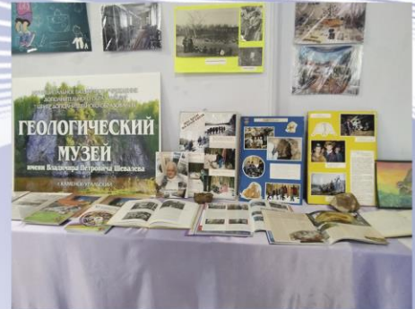
Выставка к юбилею геологического музея имени В.П.Шевалёва