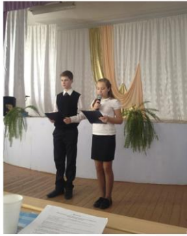
Ведущие конференции, учащиеся школы № 16