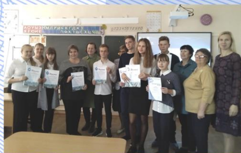
Секция «Летопись родного края»