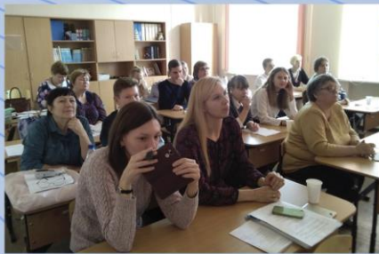
Работа секции «Летопись родного края»