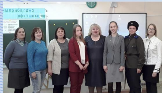
Секция «Родословие. Земляки»